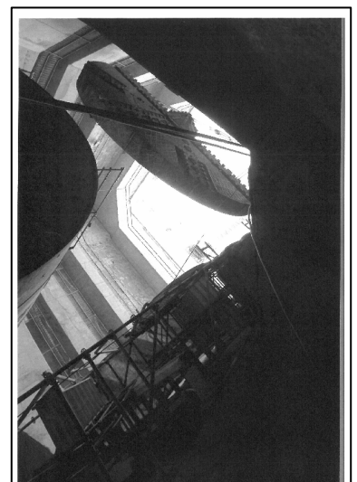
Título: Accesos a pozo de extracción Autor: M a Paz Holanda Blas